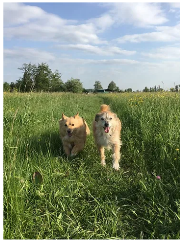
Timmy mit Golia