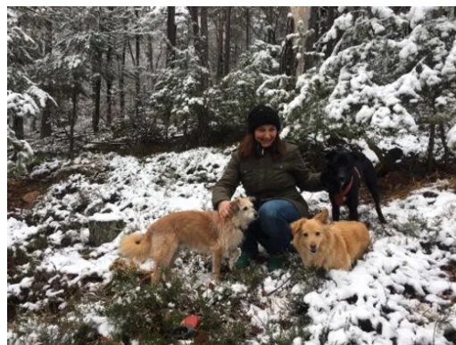
Unser Rudel mit mir