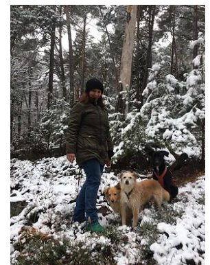
Unser Rudel mit mir

Würden wir noch einmal einen Hund adoptieren wollen, so wäre Nieves unsere erste Anlaufstelle. Die Hunde werden bei ihr verantwortungsvoll versorgt, die Charakterisierung stimmt, und sie werden gesund und gepflegt in ihr neues Zuhause entlassen.