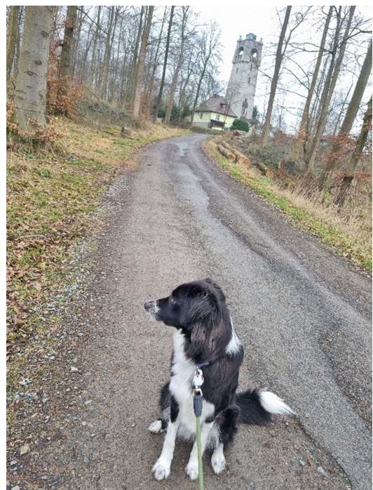
Abb 3: ...mit Suse unterwegs

Wenn man nach dem berühmten Haar in der Suppe suchen möchte, dann ist es bei Suse das Autofahren. Das ist das Einzige, was sie nicht so mag, aber auch dafür haben wir eine Lösung gefunden. Es gibt einen Eimer, in den sie zur Not rein brechen kann, aber zu unserem großen Glück klappte das Autofahren mittlerweile ganz gut ohne Erbrechen.