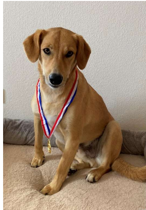
Abb 1: Teddy vormals Labus

Teddy kam im Juni 2023 in unsere Familie. Da Teddy noch sehr jung war, hatte er kein Problem damit, jetzt TEDDY zu heißen. Es war sehr schnell klar, dass wir diesen tollen Hund nicht mehr gehen lassen wollen.