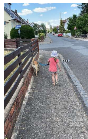
Abb 4: Teddy mit unserer Tochter

Seine Stellung in unserem Familienrudel hat er sehr schnell angenommen, sodass auch unsere Tochter viel Spaß daran hat, mit Teddy zu üben. Er ist sehr gelehrig und kapiert sehr schnell, was man von ihm will. Teddy kuschelt sehr gerne und gibt die Liebe, die er bekommt, auch gerne in Form von "Küsschen" zurück.