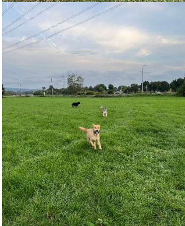
Abb 2+3: Teddy mit Freunden

Teddy ist ein lieber aufgeschlossener Hund. Er versteht sich mit fast allen seinen Artgenossen und hat schon viele neue Freunde gefunden, mit denen er regelmäßig ausgelassen tobt. Er ist, sowohl zuhause als auch unterwegs, sehr entspannt. Er freut sich, immer dabei sein zu dürfen.